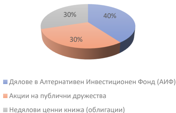
Вид и размер на извършените инвестиции със средства от облигационния заем в %

При емитирането на корпоративните облигации на „Български фонд за дялово инвестиране“ АД бяха и ще бъдат извършени разходи свързани с емитирането, които са посочени по-долу в таблица. Очаква се във връзка с процедурата по регистриране на